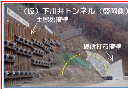
(仮)下川井トンネル（盛岡側）土留め擁壁 場所打ち擁壁 来年より開始予定のトンネル掘削に向けて坑口付近の整備を行っています。