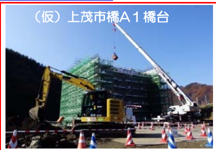
(仮)上茂市橋A1橋台 (仮)上茂市橋A1橋台の中に土の中詰を行っています。