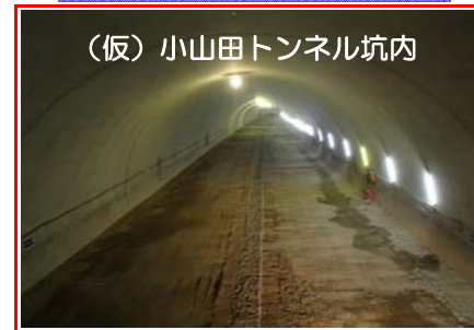
(仮)小山田トンネル坑内 (仮)小山田トンネル工事は、コンクリートによる仕上げ工事が終了し、トンネル内とトンネル入口付近を完成形に整備する工事を行っています。