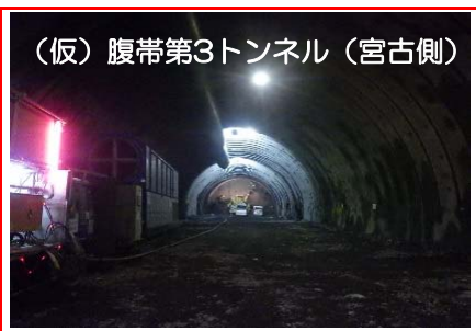
(仮)腹帯第3トンネル（宮古側） (仮)腹帯第3トンネルの掘削を行っています。全長283mのうち140mまで進んでいます。