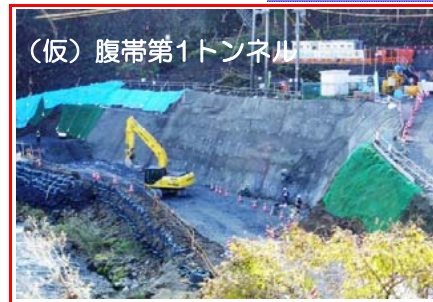
(仮)腹帯第1トンネル (仮)腹帯第1トンネル掘削のための工事用道路の造成を行っています。