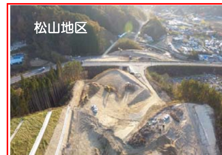
松山地区 松山地区では山を掘削して土砂を搬出しています。