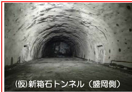
(仮)新箱石トンネル（盛岡側） 新箱石トンネルの掘削を行っています。全長1493mのうち460mまで進んでいます。