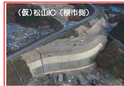
(仮)松山IC（根市側） (仮)松山IC（根市側）では切廻し道路の盛土を行っています。