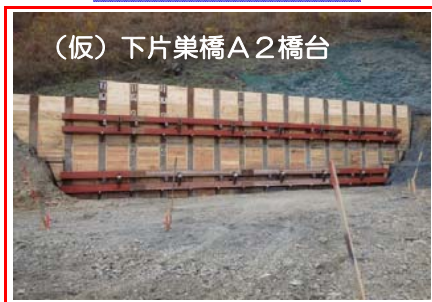
(仮)下片巣橋A2橋台 (仮)下片巣橋A2橋台を施工するため、山側に仮設土留を設置しています。