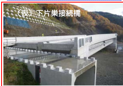
(仮)下片巣接続橋 橋梁上部工の施工は終了しました。現在は橋梁下にて排水、ヤード復旧などを行っています。