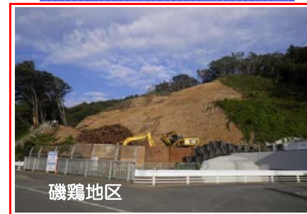
磯鶏地区 磯鶏地区で山を掘削して土砂を搬出しています。